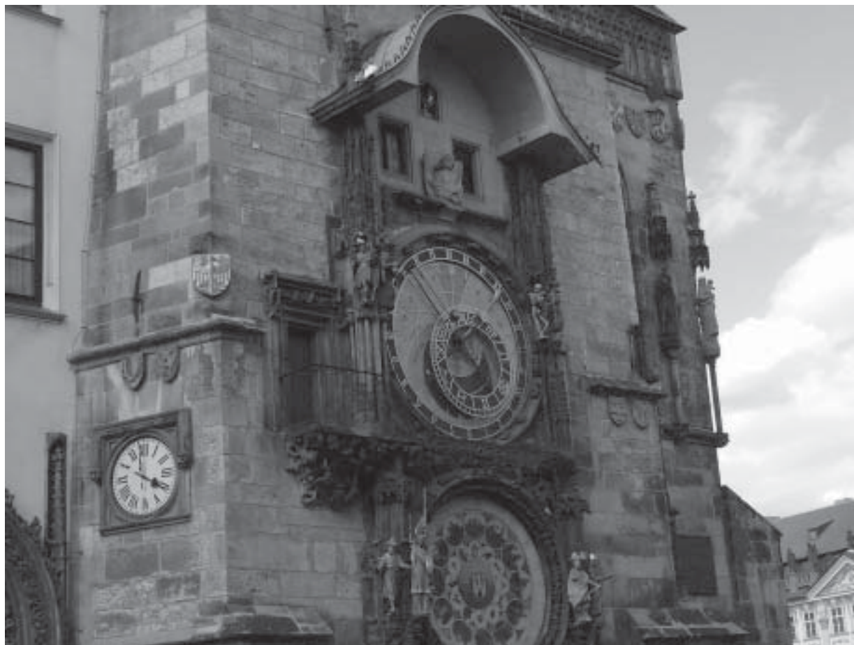
Det Astromiske Ur i Prag