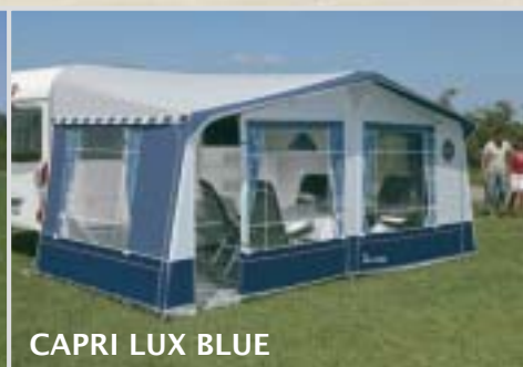
CAPRI LUX BLUE